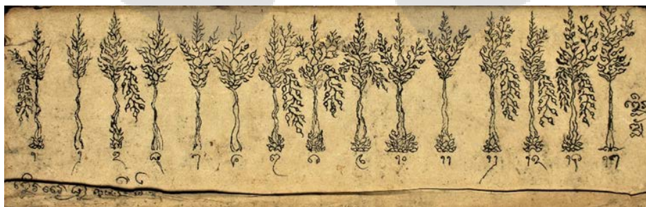
เดือนดับ

๗ จักปลูกผักเต้าแดงแพงผัก ข้าวกล้า ถั่วงา กินกัถี ที่อดูเอาที่มี--ลูกมีรากน้กนั้นเถะดินักแล ฯ เดือนออก ถอยบนนี้แล