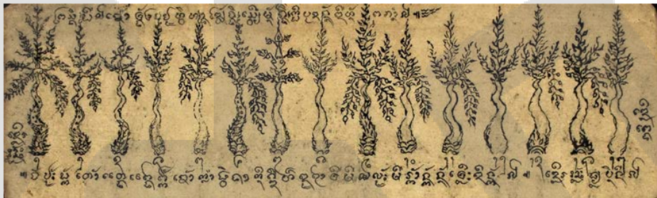
เดือนออก

พระสงฆ์ ผีแล เขาทั้ง ๒ อยู่หัวทางด้วย จงเสวยมันคงเกิดบุตรนั้นดีหนัก ภาณแล ฯ