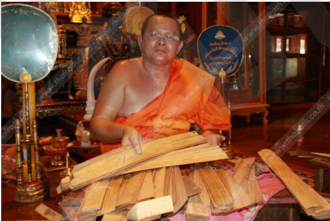
ภาพคัมภีร์ไบลานของทางวัด

ที่มาของข่าว http://www.thairath.co.th/content/421065