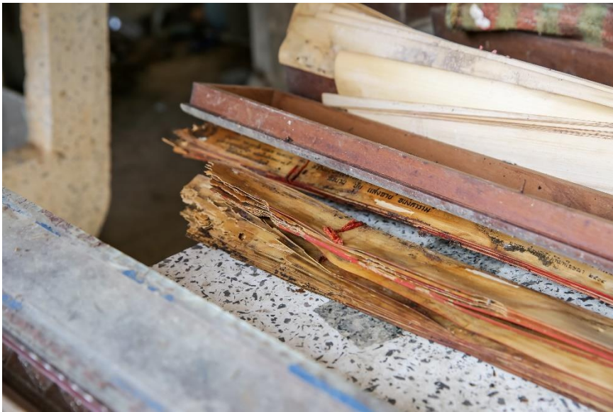
ใบลานที่ด้านปลายลานชำรุด