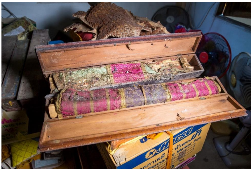
สภาพเอกสารโบราณ

กล่องไม้เป็นกล่องสี่เหลี่ยมผืนผ้า มีฝาปิด กล่องหนึ่งสามารถใส่ไบเบิลได้ 5-6 ผูก ขึ้นอยู่กับความหนาของเรื่องนั้นๆ ไม่มีลวดลาย ด้านในกล่องไม้บางกล่องพบข้อความที่เขียนเป็นภาษาไทยระบุว่า ใครเป็นผู้สร้างคัมภีร์ (เอกสารโบราณ) เป็นต้น บางกล่องพบผ้าห่อคัมภีร์แม้จะเปื่อยไปตามกาลเวลาแต่ยังคงสีสดใสให้เห็น สภาพเอกสารโบราณ เนื่องจากถูกปล่อยปละละเลยเป็นเวลานาน ประกอบกับสถานที่เก็บรักษาไม่เอื้ออำนวย มีความชื้นสูง ทำให้สภาพเอกสารโบราณบางส่วนอยู่ในสภาพชำรุด ซ้ำน กรอบ มีเศษฝุ่น ขี้จิ้งจก เศษไข่จิ้งจก และรอยแมลงกัดแทะ