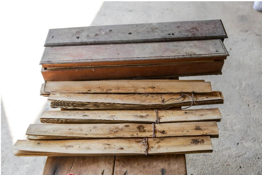
สภาพใบลานก่อนทำความสะอาด