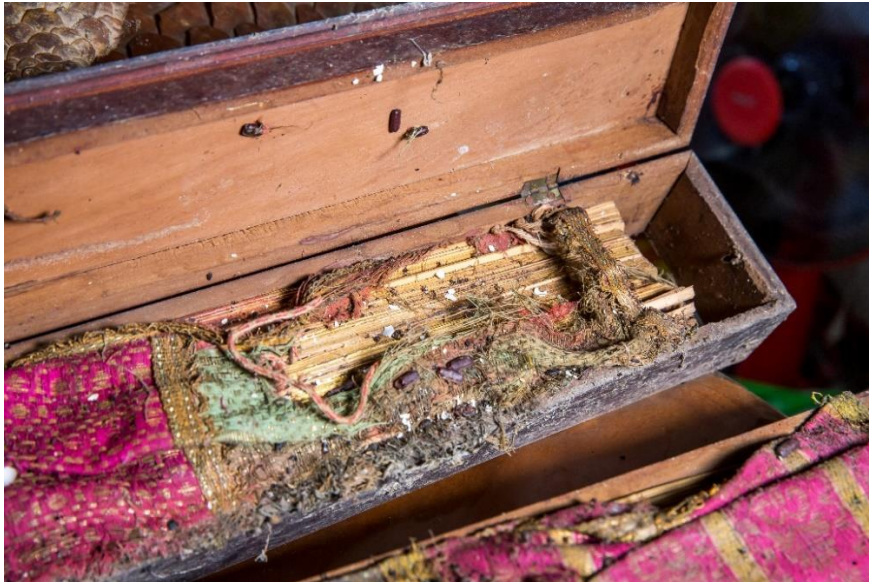
สภาพเอกสารโบราณ

การทำความสะอาดเอกสารโบราณ เริ่มจากกำจัดสิ่งสกปรกออกจากตัวเอกสาร ส่วนผ้าห่อคัมภีร์ที่พบแยกไว้อีกส่วน ปัญหาที่พบคือใบลานติดกับเป็นปึกๆ ต้องใช้เวลาและความระมัดระวังเป็นอย่างมากในการแกะออกมาเป็นใบๆ ถึงแม้ว่าใบลานจะมีความชื้นสูงแต่ก็มีความกรอบเช่นกัน หากไม่ระวังอาจทำให้ใบลานหักได้