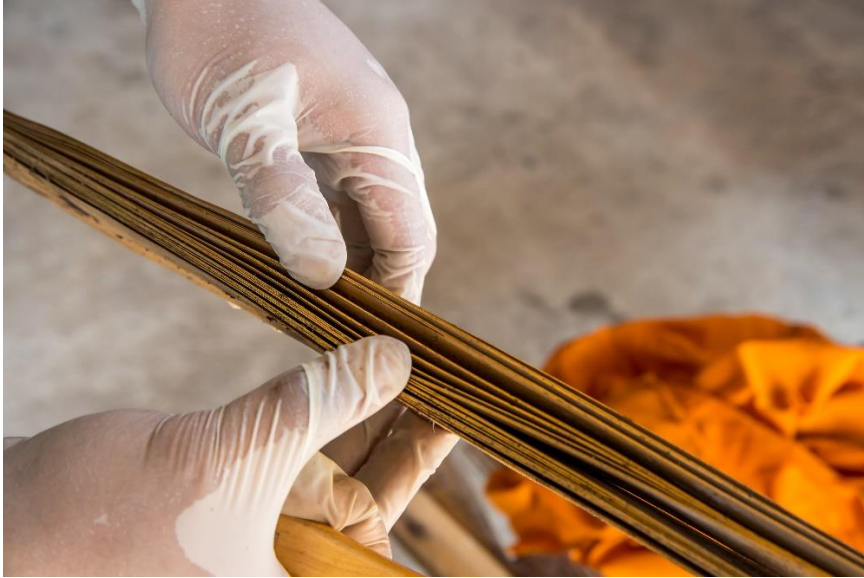
ใบลานติดกันเป็นปึก