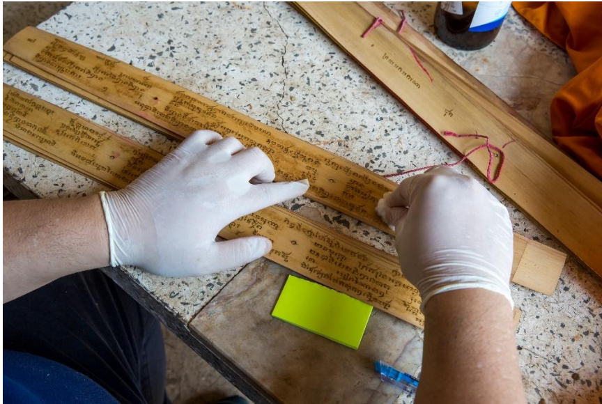
ขีดใบลานด้วยเอทิลแอลกอฮอล์