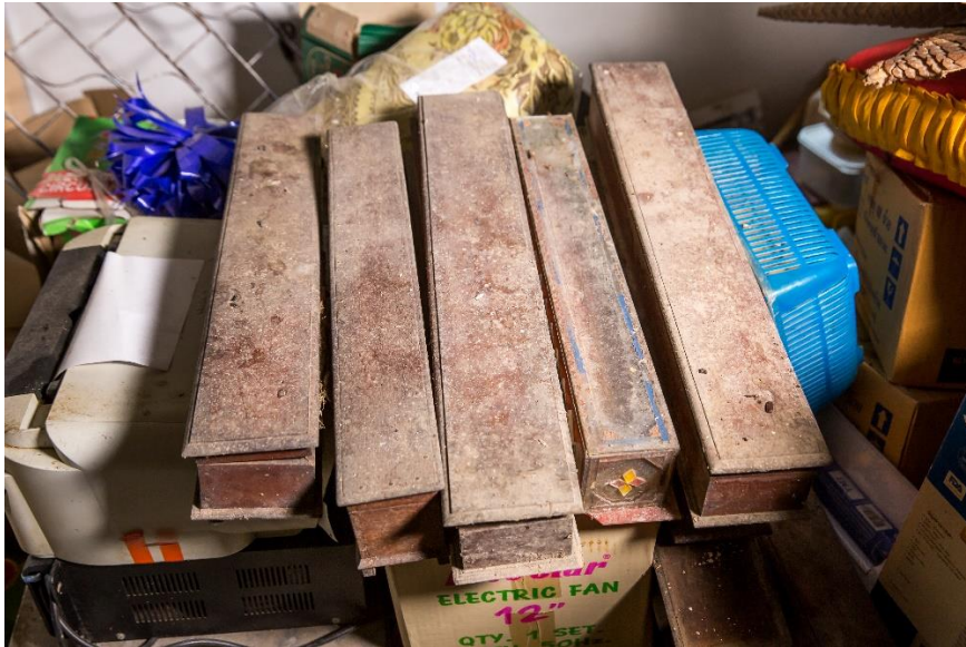
กล่องไม้ด้านในมีเอกสารโบราณ

เอามาทำบุญ เช่น หลอดไฟ กรอบรูป หนังสือ ฐูปเทียน พัดลมที่ชำรุด เป็นต้น ข้าวของเหล่านี้วางทับอยู่บนกล่องที่ใส่คัมภีร์ไบเบิลที่วางไว้กับพื้น คัมภีร์ไบเบิลของวัดนี้มีความเสี่ยงในเรื่องความชื้น และน้ำท่วมได้ กล่องไม้ประมาณ 15 กล่อง กล่องไม้ที่มีไบเบิลประมาณ 6 กล่อง กล่องหนึ่งมีไบเบิล 5-6 ผูก