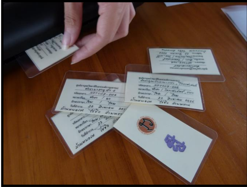
ทำบัตรทะเบียน รายการเอกสารแต่ละชิ้น