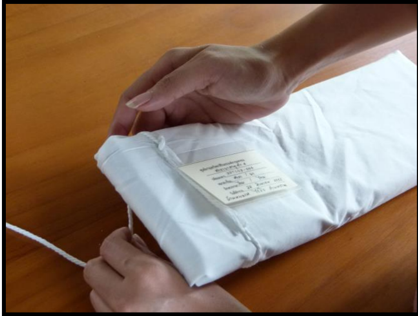
ห่อเอกสารพร้อมมัดกับแผ่น ป้ายทะเบียนเอกสาร