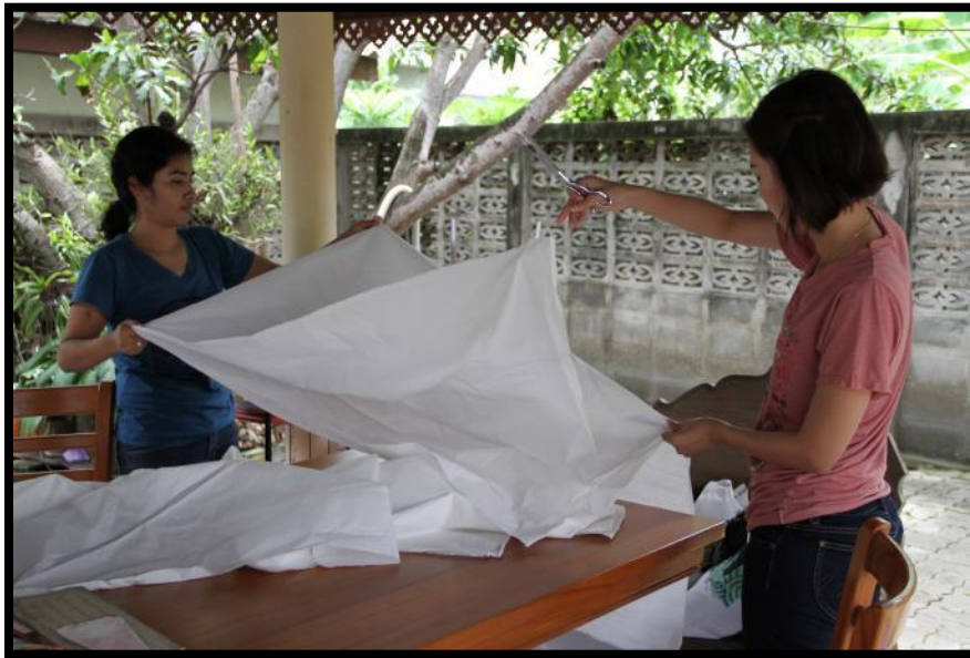
ตัดผ้าให้ได้ขนาด ตามที่ต้องการ เพื่อห่อเอกสาร