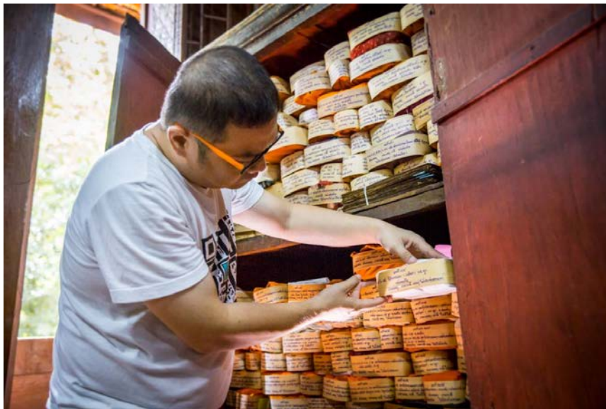
คัดเลือกเอกสารโบราณมาทำทะเบียน