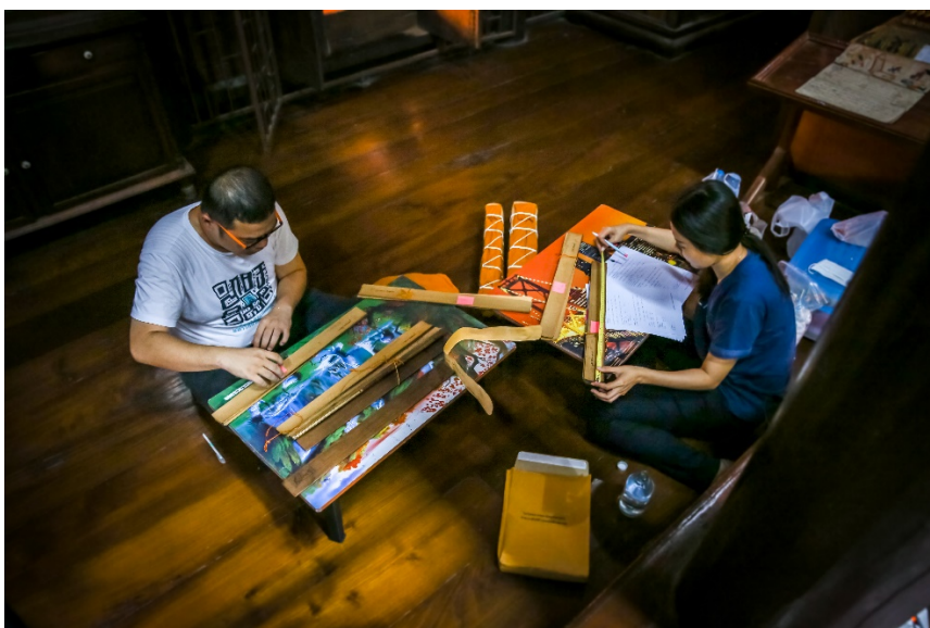
วัดขนาดเอกสารโบราณและทำทะเบียน