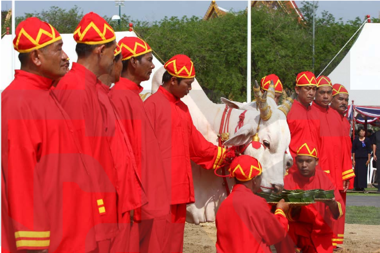
ภาพเสียดายพระโค: http://media.thai.gov.th/pageconfig/album1/index.asp?aid=5879&pageno=

นอกจากนี้พราหมณ์ยังได้เสียดายของกิน 7 สิ่ง ที่ตั้งเลี้ยงพระโค ซึ่งผลเสียดายพระโคกิน ข้าวโพด พยากรณ์ว่า ธัญญาหาร ผลาหาร จะบริบูรณ์ดี และพระโคกินหญ้า พยากรณ์ว่า น้ำท่าจะบริบูรณ์พอสมควร ธัญญาหาร ผลาหาร ภิกษาหาร มั่ง สหาหาร จะอุดมสมบูรณ์ดี ทั้งนี้ทั้งนั้นพิธีกรรมดังกล่าวอันเป็นพระราชประเพณีที่สืบทอดต่อกันมาโดยพระมหากษัตริย์ นัยหนึ่ง เพื่อให้เป็นขวัญกำลังใจแก่พสกนิกรที่ทำเกษตรกรรม