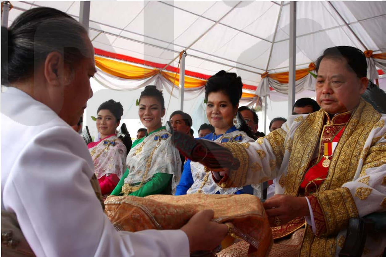
ภาพการเลี้ยงথাหยิบผ้า: http://media.thaigov.go.th/pageconfig/album1/index.asp?aid=5879&pageno=

พระราชพิธีจรดพระนังคัลแรกนาขวัญ ในปี พ.ศ. 2556 นี้ ได้มีการพยากรณ์ถึงความสมบูรณ์ของพืชพันธุ์ธัญญาหารของประเทศ โดยพระยาแรกนาได้เสียหายหีบผ้านุ่งแต่งกาย ได้ผ้า 4 คืบ พยากรณ์ว่าน้ำจะมากสักหน่อย นาในที่ดอนจะได้ผลบริบูรณ์ดี นาในที่ลุ่มอาจจะเสียหายบ้าง ได้ผลไม่เต็มที่