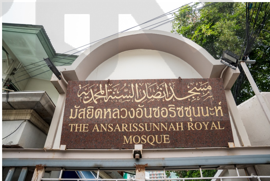
ภาพ 2 ป้ายมัสยิดหลวงอันซอริชสุนนะห์