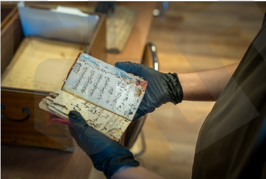
ภาพ 6 สํารวจเอกสาร และค้ดแยกประเภท