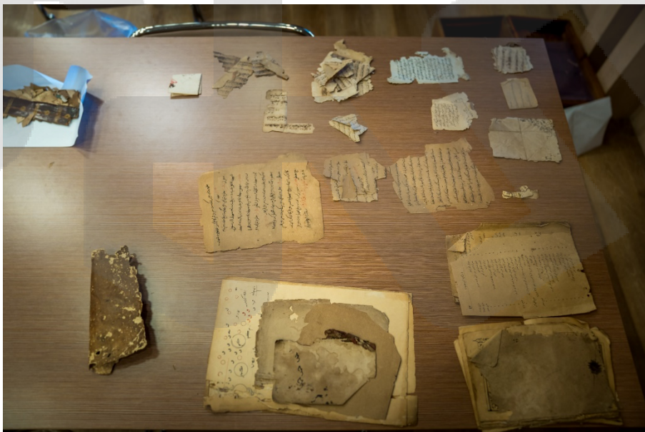
ภาพ 8 สํารวจเอกสาร และค้ดแยกประเภท ที่มา: ศุภกรานต์ พุ่มพฤกษ์, 26 กุมภาพันธ์ 2568