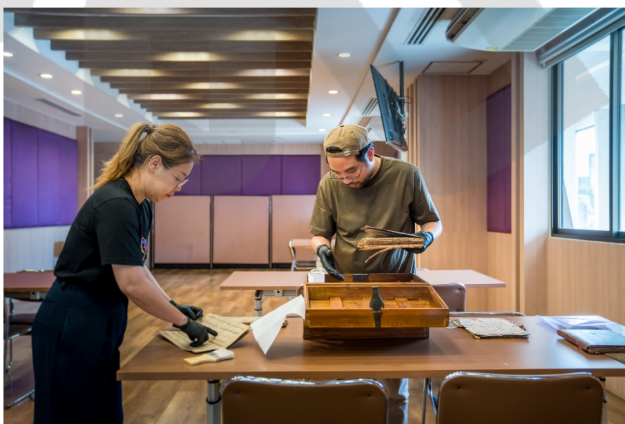
ภาพ 4 สํารวจเอกสาร และค้ดแยกประเภท