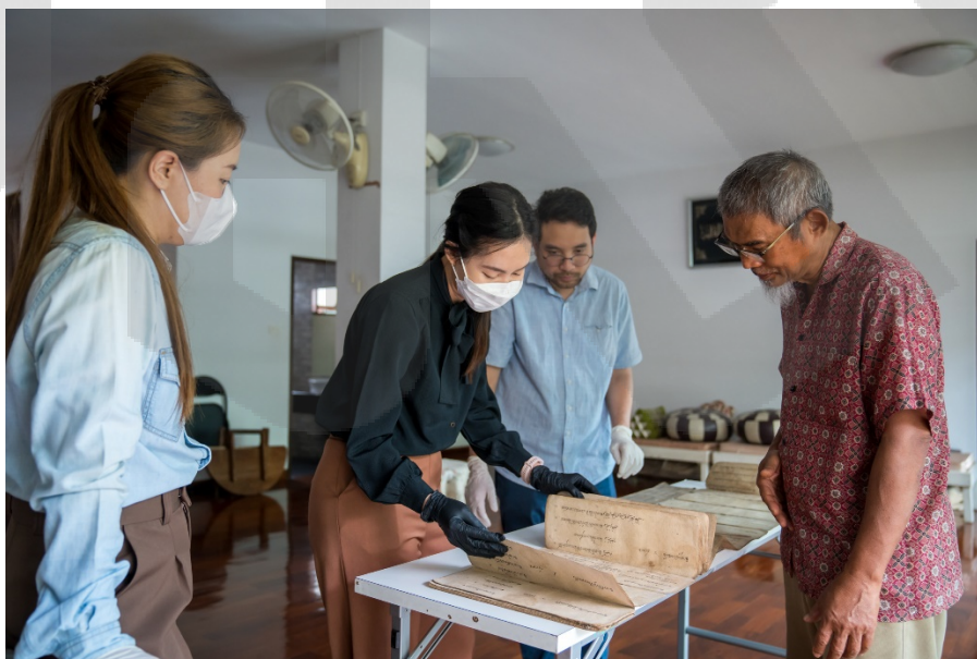
ภาพ 3 สำรวจเอกสารมุสลิม

ส่วนสมุดฝรั่งนั้นมีหลายเล่ม จึงขอยกเล่มที่น่าสนใจ อาทิ คัมภีร์อัลกุรอาน อักษรอาหรับ การตกแต่งด้วยการลงสีอย่างสวยงาม และเย็บก็เข้าเป็นเล่มเดียวกัน เนื่องจากคัมภีร์อัลกุรอานบางแห่งจะจัดเก็บเป็นเล่มเล็ก ๆ แยกเฉพาะบทเท่านั้น อาจเป็นในเรื่องความสะดวกในการหยิบมาใช้ หรือการพกพาก็เป็นได้