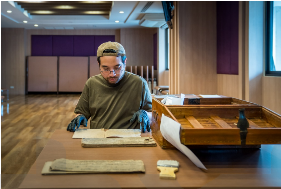
ภาพ 5 สํารวจเอกสาร และค้ดแยกประเภท