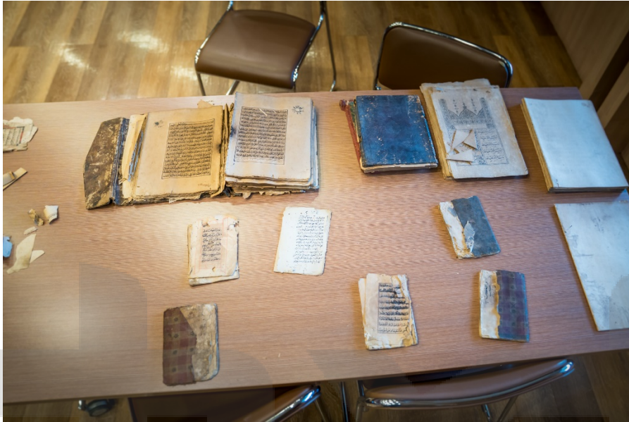
ภาพ 9 สํารวจเอกสาร และค้ดแยกประเภท