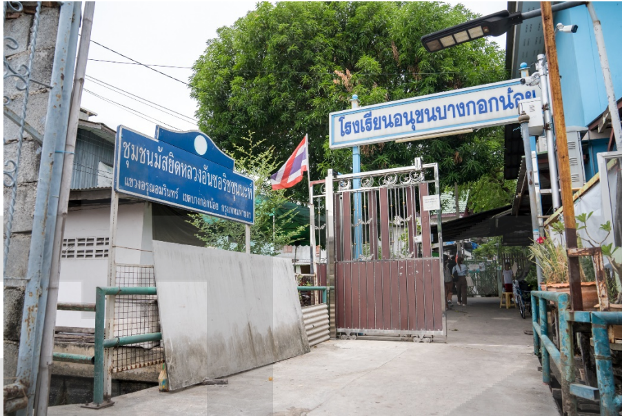
ภาพ 1 ชุมชนมัสยิดหลวงอันซอริชสุนนะห์

การรื้อใน พ.ศ.2450 ซึ่งมีหลักฐานเป็นศิลาจารึกหินอ่อน 2 หลัก ที่บันทึกประวัติศาสตร์ที่มาของที่ดินของชุมชนมัสยิดหลวงฯ ต่อมามัสยิดและโรงเรียนแห่งนี้ได้รับผลกระทบอย่างหนักในช่วงสงครามโลกครั้งที่ 2 พ.ศ.2487 จึงได้มีการระดมทุนจากบรรดาพี่น้องชาวมุสลิมเพื่อสร้างมัสยิดหลังใหม่ทดแทนหลังที่ถูกระเบิดเสียหายไป (คลังข้อมูลชุมชน, 2564: ออนไลน์)