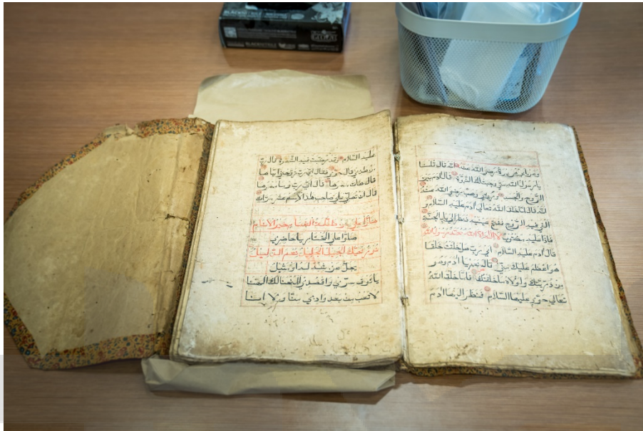
ภาพ 13 เอกสารประเภท สมุดฝรั่ง เรื่อง ตำรารวมบทขอสรรเสริญและชีวประวัติของนะบีมุฮัมมัด ที่มา: ศุภกรานต์ พุ่มพฤษ, 26 กุมภาพันธ์ 2568