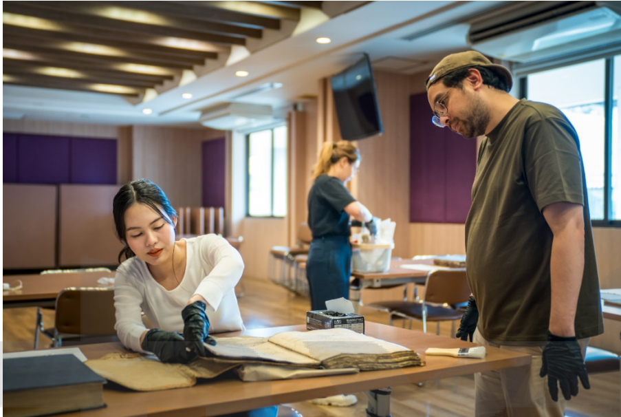
ภาพ 7 สํารวจเอกสาร และค้ดแยกประเภท ที่มา: ศุภกรานต์ พุ่มพฤกษ์, 26 กุมภาพันธ์ 2568