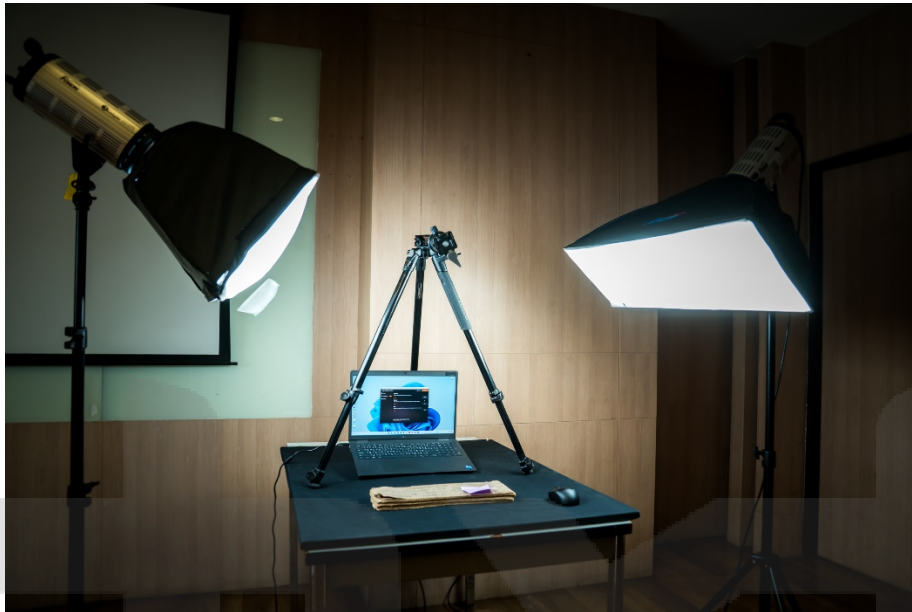
ภาพ 11 จัดทำสำเนาดิจิทัลเอกสาร