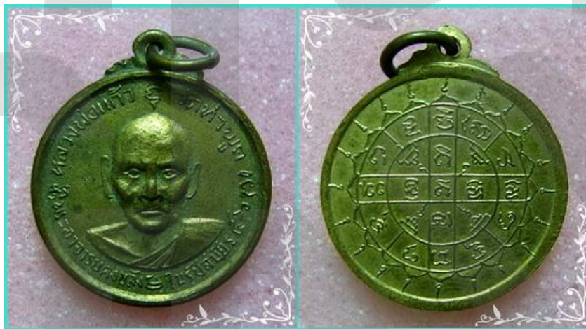
ภาพที่ 1 เหรียญหลวงพ่อกแก้ว วัดท่าพูด

หลวงพ่อกแก้ว เป็นอดีตเจ้าอาวาสวัดท่าพูด องค์ที่ 5 ในช่วงพุทธศักราช 2411 ถึง 2453 ซึ่งอยู่ในรัชสมัยของพระบาทสมเด็จพระจุลจอมเกล้าเจ้าอยู่หัว รัชกาลที่ 5 ประวัติความเป็นมาของท่านสามารถหาอ่านได้จากหนังสือประวัติวัดท่าพูด 1