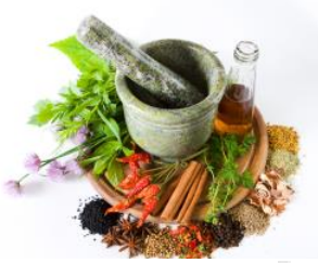
ภาพสมุนไพร

ก่อนที่จะมีการรักษาพยาบาลแบบตะวันตกเข้ามา คนไทยรักษาโรคด้วยสมุนไพรกันมานานแล้ว คนไทยรู้จักการใช้พืชมาประกอบเป็นยารักษาโรคโดยอาศัยสรรพคุณของพืชนั้นๆ ผู้ที่ประกอบยาสมุนไพรเราเรียกว่า “หมอยา” การนำสมุนไพรมาประกอบเป็นยารักษาโรคนั้นเป็นศาสตร์แขนงหนึ่งที่ต้องร่ำต้องเรียนกันก่อนถึงจะทำได้ เพราะการใช้ยาสมุนไพรนั้นมีทั้งให้คุณและให้โทษ หากมีการใช้ยาที่เผลอกับโรคก็อาจทำให้เกิดผลเสียต่อร่างกายได้ ดังนั้นคนที่จะเป็น “หมอยา” ต้องมีทั้งความรู้เรื่องสมุนไพรและการใช้เป็นอย่างดี มีความเชี่ยวชาญในการประกอบยา การวินิจฉัยโรค และคุณสมบัติของหมอยาที่จะขาดเสียไม่ได้ก็คือ “คุณธรรม”