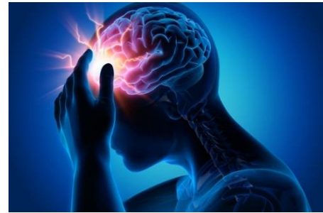
ความหมายของโรคลมชัก(epilepsy) และภาพประกอบ

โรคลมชัก (epilepsy) เป็นโรคที่เกิดจากความผิดปกติของเซลล์สมอง บริเวณผิวสมอง กล่าวคือ หากกระแสไฟฟ้าในสมองเกิดการลัดวงจรหรือเกิดความผิดปกติบางอย่างขึ้น จะทำให้ผู้ป่วยมีอาการผิดปกติทางระบบประสาท ตามมาจนไม่สามารถควบคุมตัวเองได้ อย่างเช่น ถ้าเซลล์สมองเกิดความผิดปกติบริเวณส่วนของการควบคุมกล้ามเนื้อ ผู้ป่วยจะมีอาการชักเกร็งกระตุก เหมือนถูกไฟฟ้าช็อต ชักแบบเป็น ๆ หาย ๆ หรือบางคนอาจมีอาการเกิดขึ้น เฉพาะส่วนใดส่วนหนึ่งของร่างกาย อาจหมดสติหรือไม่หมดสติก็ได้ แต่บางคนก็อาจมีพฤติกรรมนี้ๆ เหม่อลอย